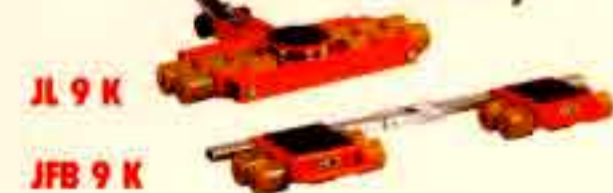
JL 9 K

Транспортиращи колички Transport castor trolleys