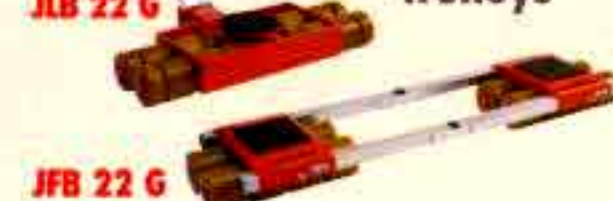
JLB 22 G

Транспортиращи колички Transport castor trolleys