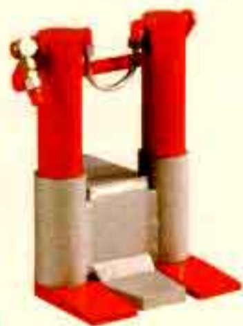
JH 30 P

Хидравлични повдигащи инструменти Hydraulic jacks